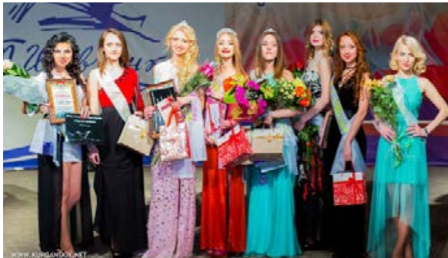
Кращі красуні факультету

Наступне дефіле було в стилі «жінка-кішка». Учасниці конкурсу з'явилися перед публікою в елегантних спокусливих вбраннях, головною «фішкою» яких стали вишукані краватки-метелики.