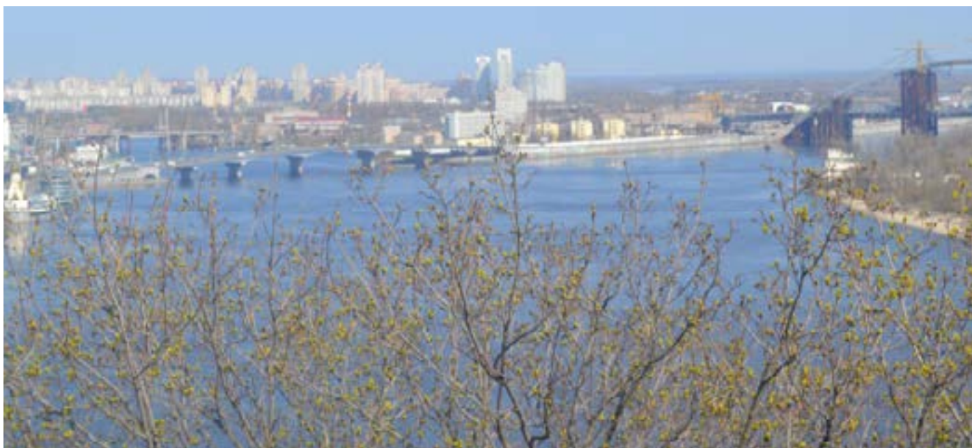
Євген ЛИТВИНЕНКО, 3-ВС

Запах весни бентежить душу. І вже скоро прийде тепло, і все розквітне, і світ стане яскравішим