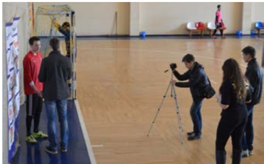
Команда Молодіжної Ліги

Пошук команд став головною проблемою проекту. Організатори самотужки відвідували навчальні заклади, спілкувались із керівництвом, заохочували молодь до участі через соціальні мережі.