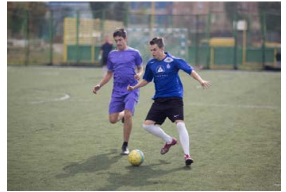
Весняний турнір з міні-футболу

ються писати звіти, анонси, брати інтерв'ю у футболістів, висвітлювати поточні події й заходи «Молодіжної Ліги» та «Зорі».