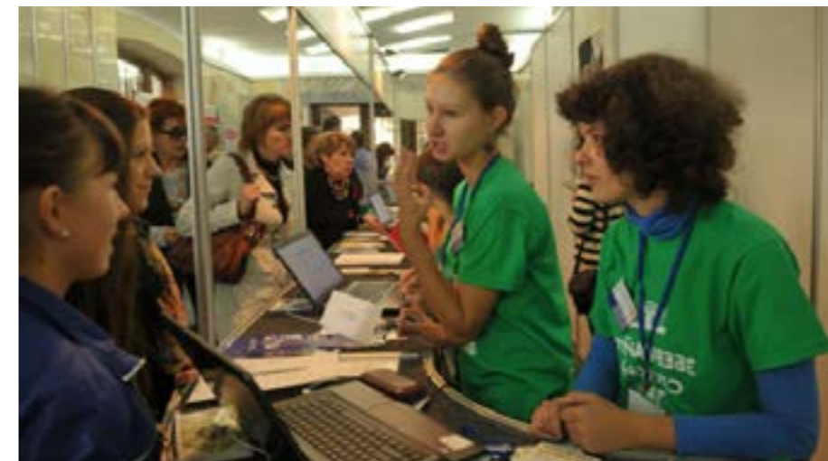
Волонтери під час акредитації журналістів