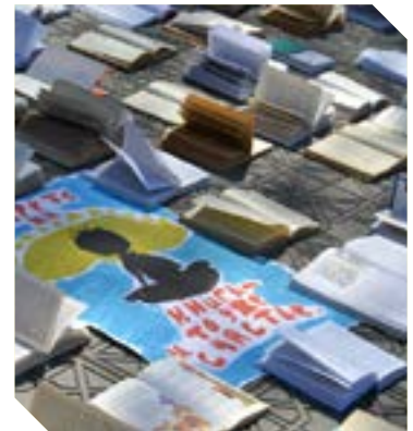
Час творити добро с.3

■ 25 березня в Луганському національному університеті імені Тараса Шевченка відбувся медіа-фестиваль «Ми твій світанок, Україно!». Організаторами заходу виступила кафедра журналістики вузу спільно з обласною організацією Національної Спілки журналістів України.