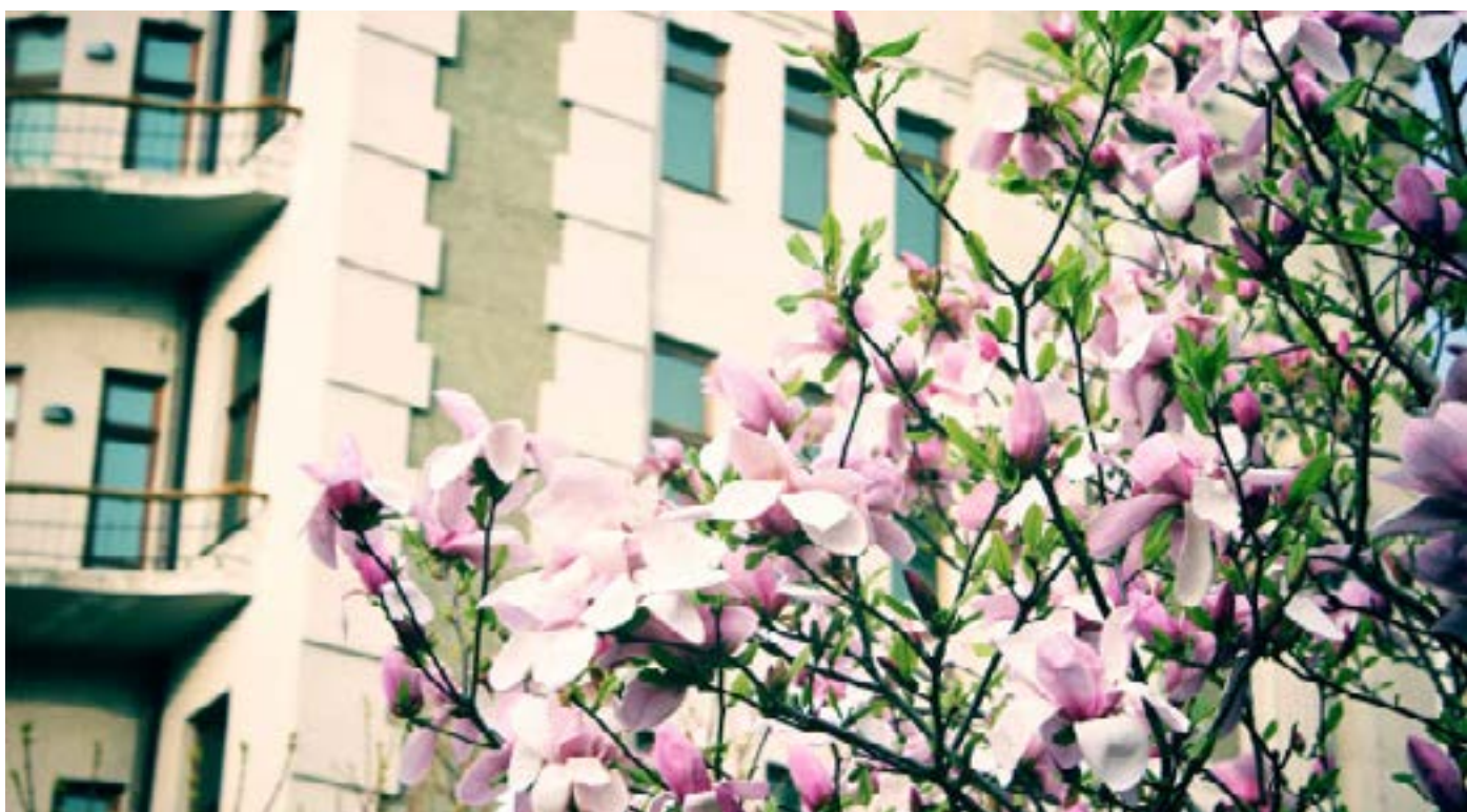
Вікторія ТРЕТЯКОВА, 3-Ж

Весна прийде до кожного, незважаючи на погоду в домі