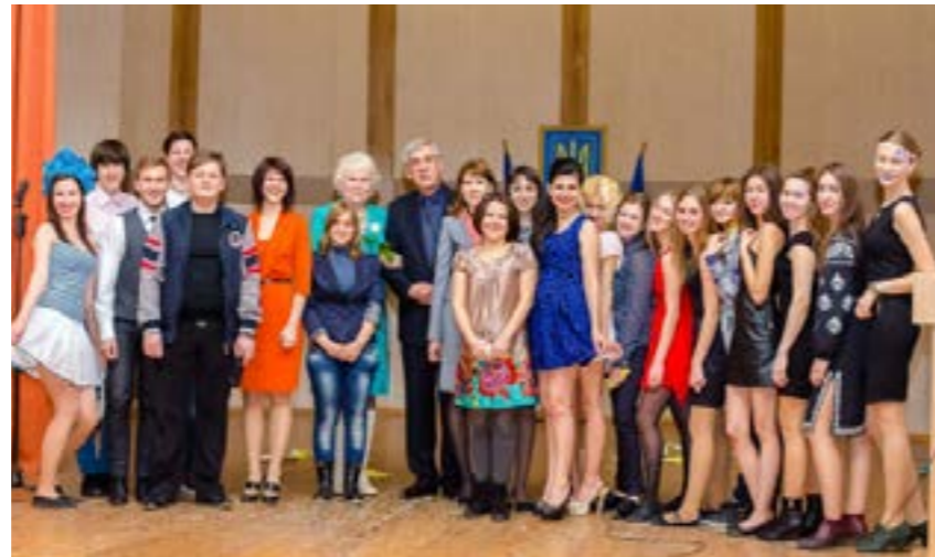
Майстерня, де формується думка молодого покоління