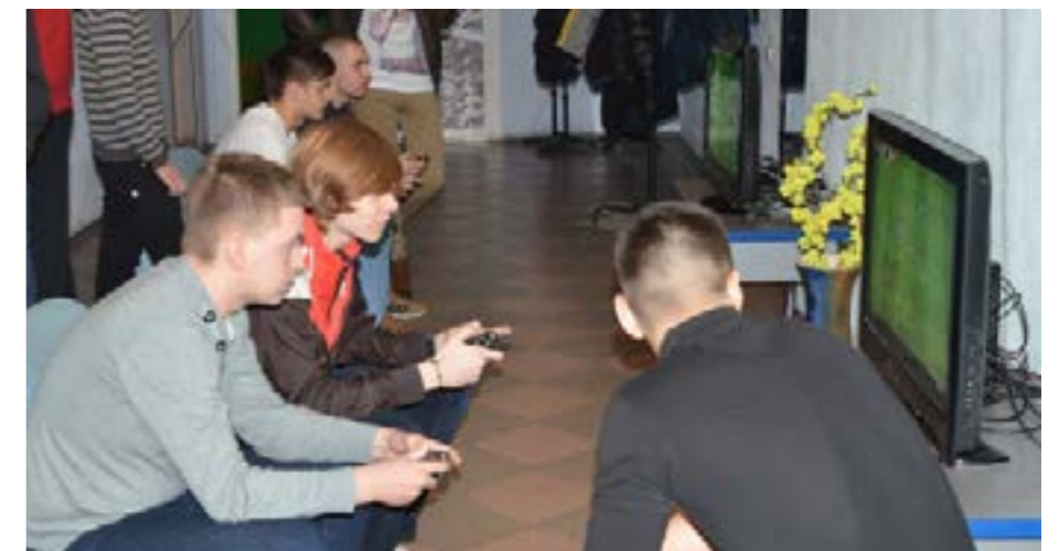
Перший турнір з кіберфутболу