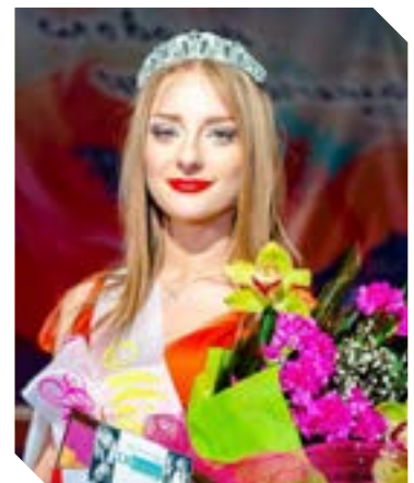
Красуня факультету с.6