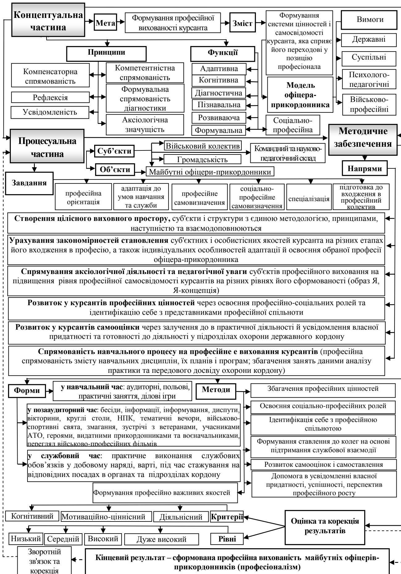
Рисунок 3 – Педагогічна система професійного виховання майбутніх офіцерів-прикордонників

( → ієрархічні зв'язки; -> корекційні зв'язки)