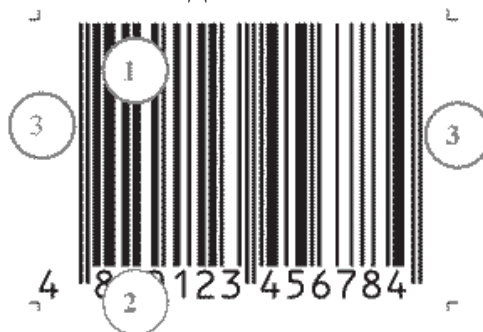
Рисунок 2 – Основные обязательные элементы штрихкодowego обозначения GTIN-13: